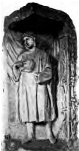
Stèle gallo-romaine (Musée archéologique).

De cette ville romaine, tout a disparu ou presque tout. Les murailles, où les habitants venaient puiser des matériaux pour restaurer leurs demeures, furent détruites à partir de 1443 sur l'ordre de Philippe le Bon, et il n'en existe sur place que quelques rares fragments : des débris de murs rue Chabot-Charny 49 et 36. et rue Hernoux 7; des débris de tours rue Longepierre 4, et surtout rue Amiral-Roussin 23 (tour dite du Petit-Saint-Bénigne). Aucun gros monument n'a été reconnu.